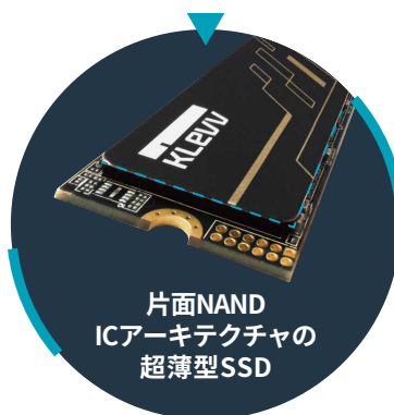
片面NAND ICアーキテクチャの 超薄型SSD